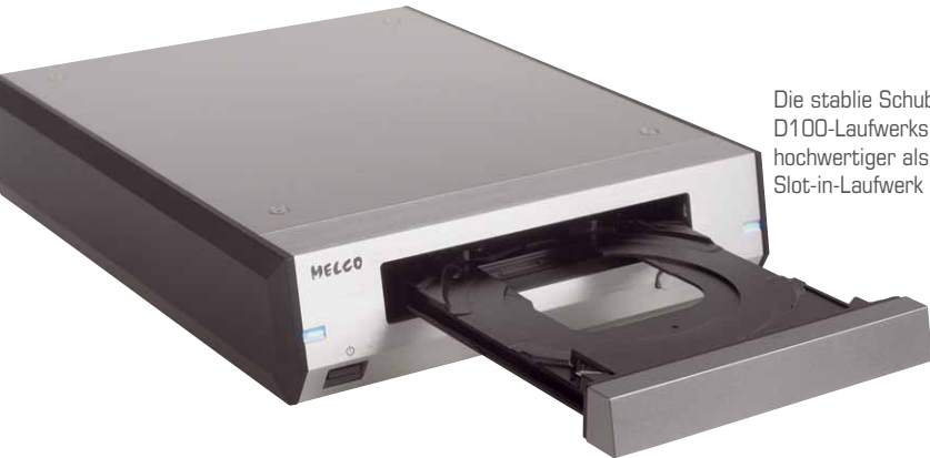
Die stabile Schublade des D100-Laufwerks wirkt deutlich hochwertiger als ein typisches Slot-in-Laufwerk

Bibliothek zu erweitern, oder als Hauptbibliothek für einen Streamer. Viele aktuelle Netzwerkplayer ermöglichen den Anschluss von externen Massenspeichern, so dass man prinzipiell kein NAS mehr benötigt, sondern die Dateien direkt abspielt. Das Netzwerk wird in diesem Fall nur noch zur Steuerung oder für den Internetanschluss genutzt.