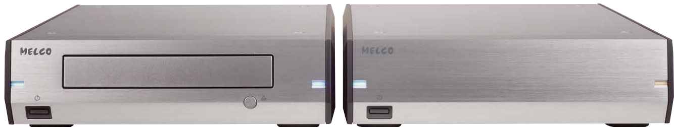
Die beiden hochwertig verarbeiteten Geräte machen sich gut in jedem Rack und stehen anderen HiFi-Komponenten in Sachen Design in nichts nach