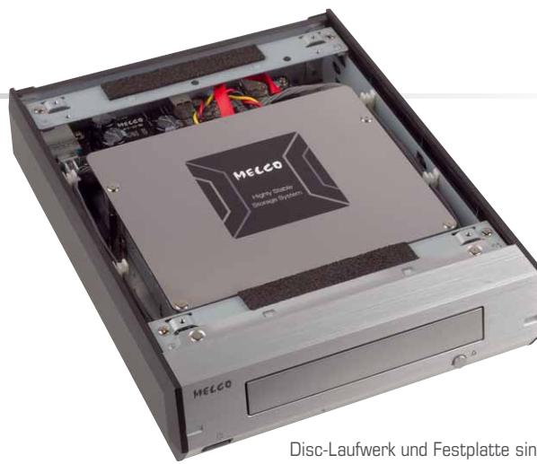
Disc-Laufwerk und Festplatte sind in ihren jeweiligen Geräten gut gegen Vibrationen und Erschütterungen geschützt

mit dem D100 deutlich direkter und musikalischer an. Der Preis, den Melco für die beiden Erweiterungen aufruft, ist im Vergleich mit externen Festplatten und CD-Laufwerken aus dem Elektronikmarkt natürlich zunächst mal ein krasser Unterschied. Letztlich muss man sich aber bewusst sein, dass die beiden Geräte HiFi-Komponenten sind, die sich ihren Platz an der heimischen Anlage durchaus verdienen. Das aufwendige