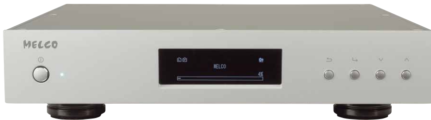
Für Melco-Server wie den N1Z sind die Erweiterungen die erste Wahl, doch auch andere Systeme können D100 und E100 nutzen