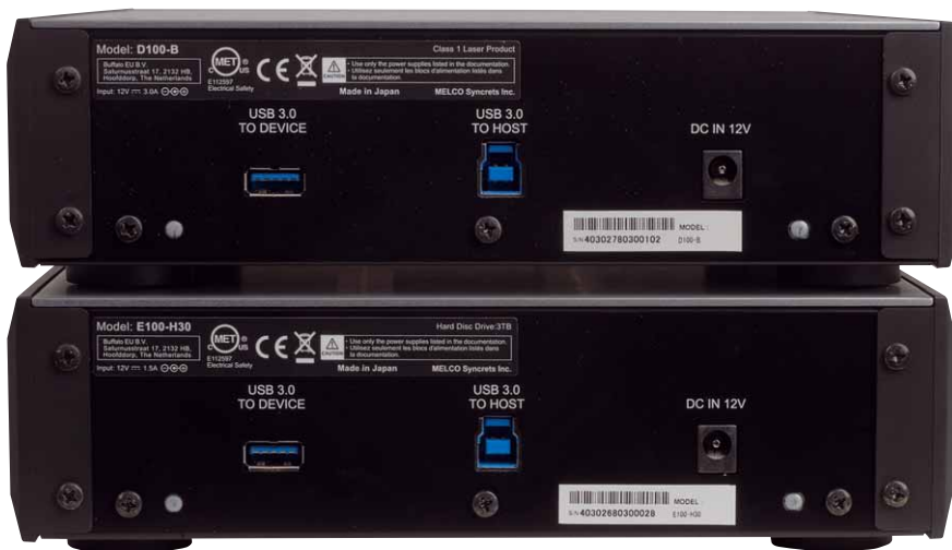
Dank USB 3.0 geschieht die Datenübertragung äußerst zügig

Im Einsatz machten D100 und E100 dennoch eine gute Figur. Beim Anschluss an Rechner und Musikserver wurden die beiden Geräte auf Anhieb erkannt und boten Zugriff auf die gespeicherte Musik oder eingelegte Datenträger. Das Überspielen auch großer Datenmengen auf das E100 war dank der schnellen USB-Verbindung in wenigen Minuten erledigt, so dass der Speicher nach dem Anschluss in kürzester Zeit zu einem Teil der Anlage werden kann. Auch das Rippen von CDs funktionierte mit dem D100 wunderbar. Im Vergleich mit einem herkömmlichen externen CD-Laufwerk konnte Melcos Ergänzungssystem klar punkten. Gerade bei der direkten Wiedergabe von Musik hörte sich das gleiche Album beim Abspielen