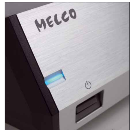
Die leicht versenkten Power-Tasten können die Geräte separat ausschalten, während das Einschalten den Anschluss eines passenden HiFi-Systems erfordert